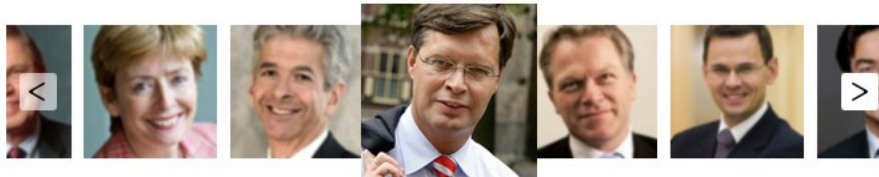
Jan Peter Balkenende

Minister-president | Minister van Algemene Zaken